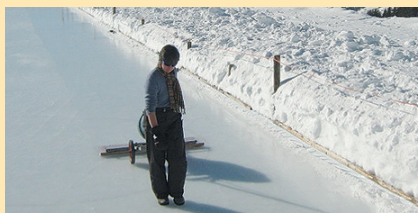
Für ein fast perfektes Eis: Arbeit mit der «Mini Zamboni»-Eismaschine

renaugabe sind montiert worden und erlauben inskünftig einen verbesserten Tagesbetrieb.