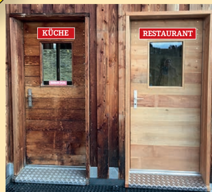
Neuer Eingang zum Restaurant

Erholung pur am schönsten Ort der... für ein fast perfektes Eis investieren wir täglich ca. 3-4 Std. oder über die ganze Saison 350 Std. für das Eisfeld. Das ist nur möglich, dank den vielen freiwilligen Helfern und den grosszügigen Spenden. Manchmal müssen wir das Eis für Schlittschuhe sperren, weil es zu weich ist. Da spielen natürlich Lufttemperatur und Sonneneinstrahlung eine grosse Rolle. Aber wie auch immer, wir geben alles, damit all unsere Gäste ein möglichst gutes Eis zur Verfügung haben, sei es für Curling, Eisstockstockschiessen oder zum Schlittschuhlaufen. Herzlich willkommen!