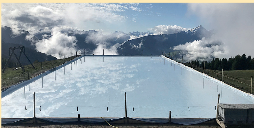
Das neue Eisfeld mit seinen 44x20 Metern erlaubt einen 4. Rink (Bahn)

Auf diese Saison hin gibt es ein grösseres Eisfeld (44x20m). Mit den neuen Massen und somit einem 4. Rink (zusätzliche Bahn) hoffen wir auf ein noch besseres Miteinander auf dem Eis.