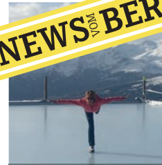
Eisprinzessin anfangs November...