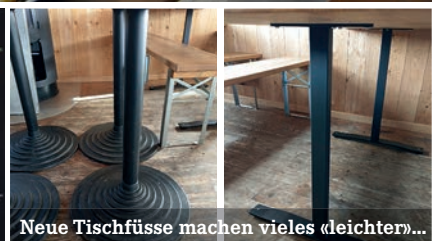
Neue Tischfüsse machen vieles «leichter»...