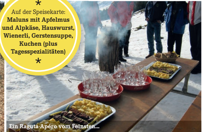
Ein Raguta-Apéro vom Feinsten...