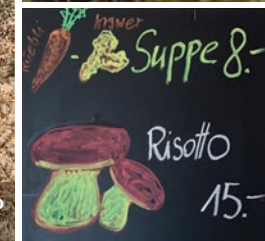
Suppe 8.- Risotto 15.-