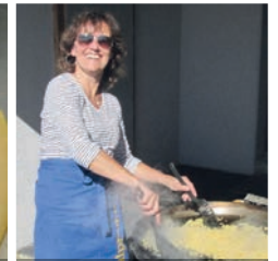
Fleissige Helferin an der Maluns-Pfanne...