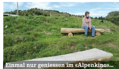
Einmal nur geniessen im «Alpenkino»...