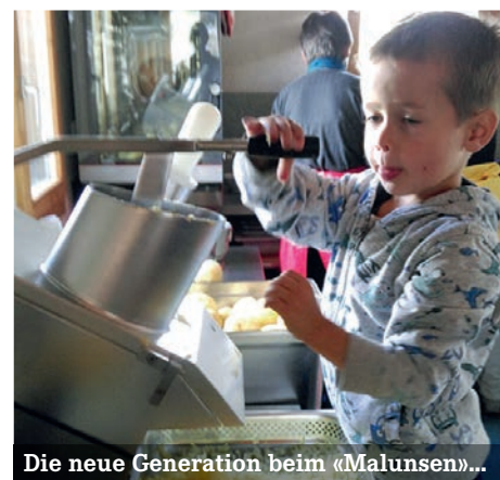
Die neue Generation beim «Malunsen»...