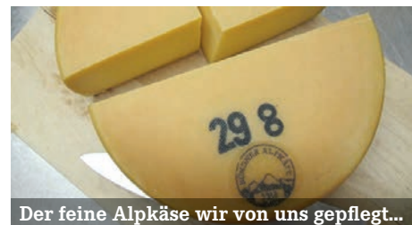
Der feine Alpkäse wir von uns gepflegt...