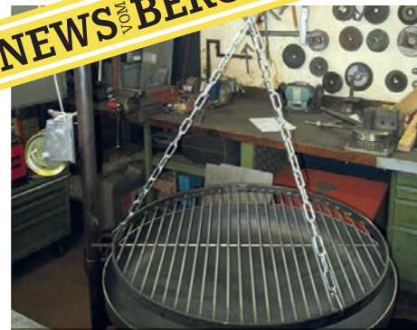
Der neue Holzkohlegrill am Entstehen...