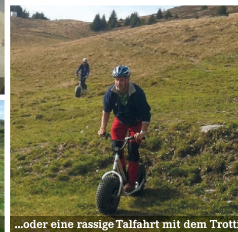
...oder eine rassige Talfahrt mit dem Trotti