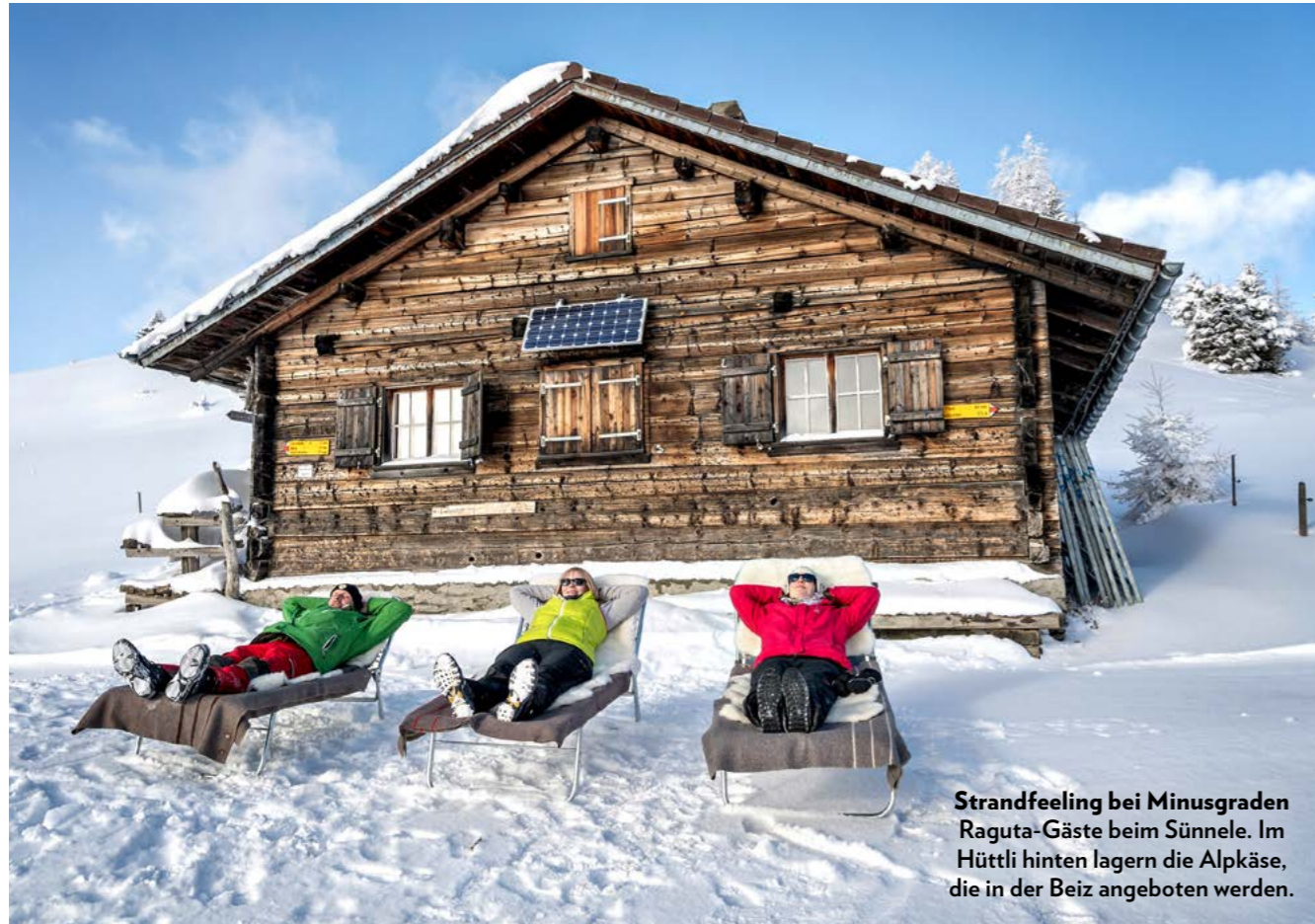
Strandfeeling bei Minusgraden Raguta-Gäste beim Sünnele. Im Hüttli hinten lagern die Alpkäse, die in der Beiz angeboten werden.