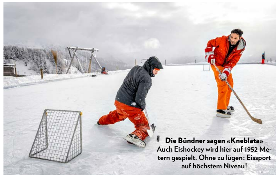
Die Bündner sagen « Kneblata ». Auch Eishockey wird hier auf 1952 Metern gespielt. Ohne zu lügen: Eissport auf höchstem Niveau!