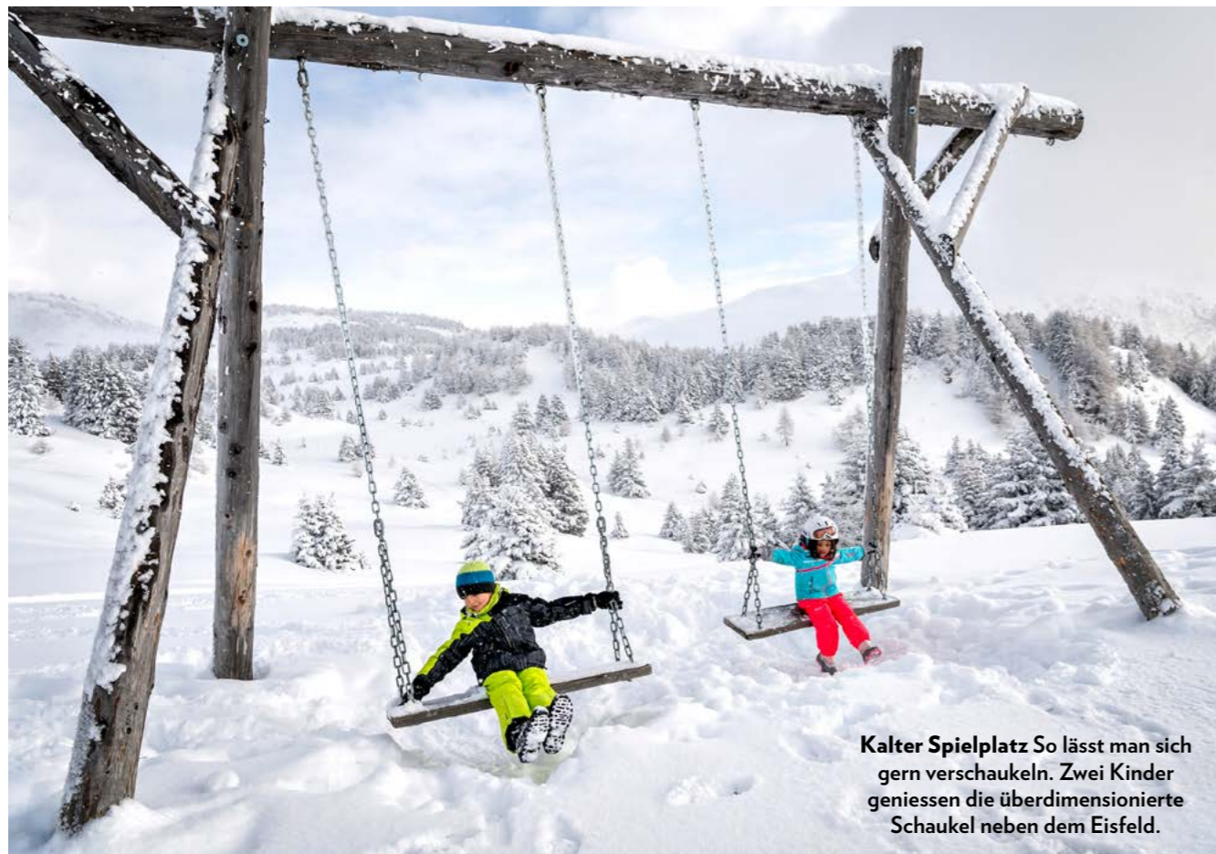
Kalter Spielplatz So lässt man sich gern verschaukeln. Zwei Kinder geniessen die überdimensionierte Schaukel neben dem Eisfeld.