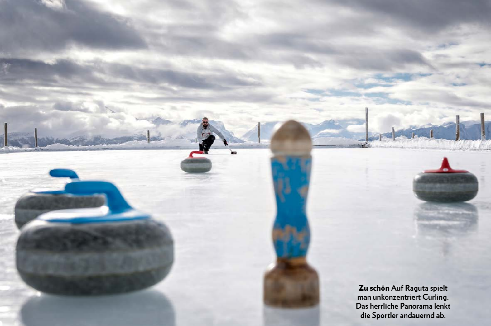
Zu schön Auf Raguta spielt man unkonzentriert Curling. Das herrliche Panorama lenkt die Sportler andauernd ab.