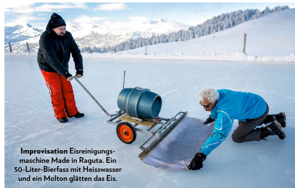
Improvisation Eisreinigungsmaschine Made in Raguta. Ein 50-Liter-Bierfass mit Heisswasser und ein Molton glätten das Eis.